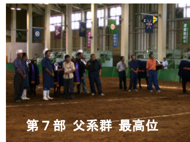
第7部 父系群 最高位