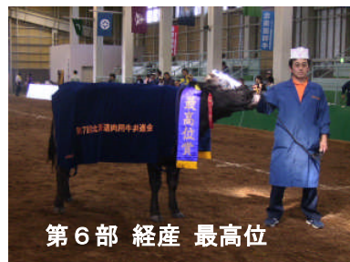
第6部 経産 最高位