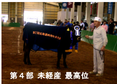
第4部 未經産 最高位